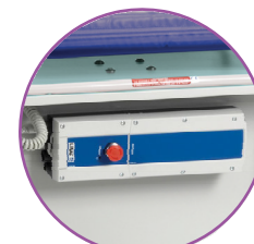
Batteria ricaricabile situata nella parte posteriore