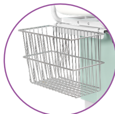
BA903 - cestello