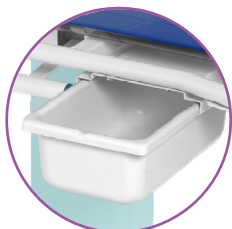
BA902 – Contenitore rifiuti